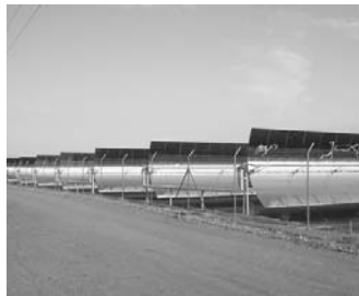
Planta termosolar. INSTYCAL

La actividad internacional de la empresa ha generado un importante negocio de futuro para esta firma