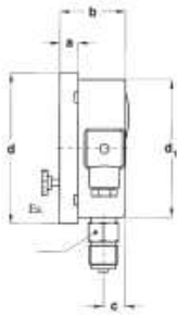
A - RADIAL